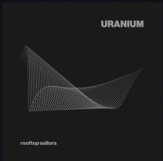
URANIUM EP, 2019