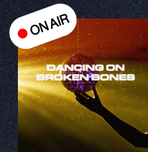
Dancing On Broken Bones | 08.12.2023