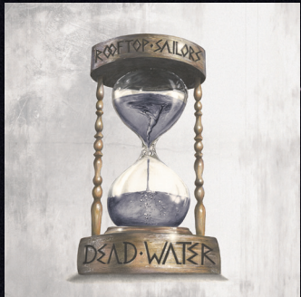
DEAD WATER EP, 2017