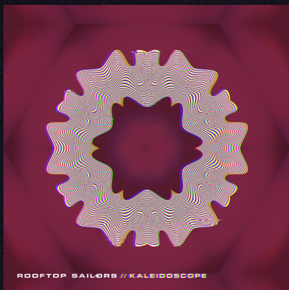
KALEIDOSCOPE ALBUM, 2021